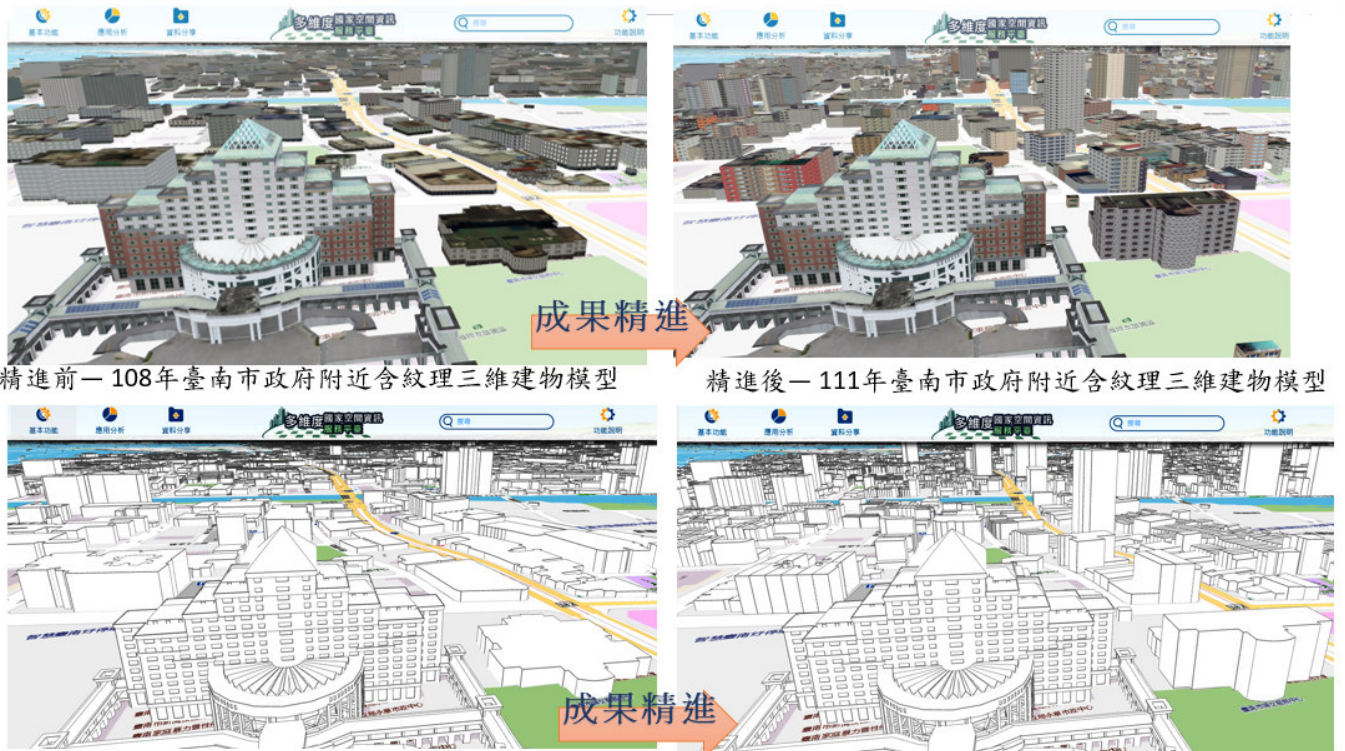
精進前—108年臺南市政府附近含紋理三維建物模型 精進後—111年臺南市政府附近含紋理三維建物模型

三維建物模型更新作業係利用最新「臺灣通用電子地圖」、「1/1,000 地形圖」之建物圖層及 DTM 最新成果，透過新舊建物框比對分析，獲取須更新標的建物框，產製三維建物模型；精進作業則是利用地籍圖資、門牌資訊及正射影像等資料，辦理臺灣通用電子地圖區塊建物框加值分棟作業，精進三維建物模型之細緻度（如圖 1），預計於 113 年底完成全國三維建物模型精進作業，全面提升三維建物模型細緻度。